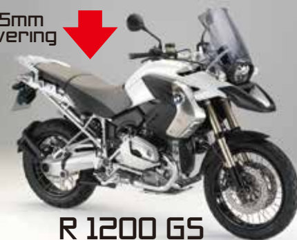
R 1200 GS