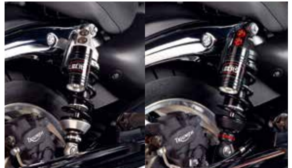
Black Line Special Line