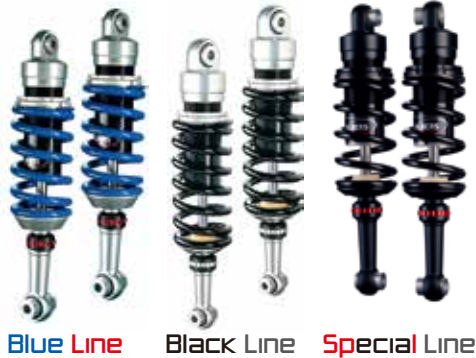
640 TS Road