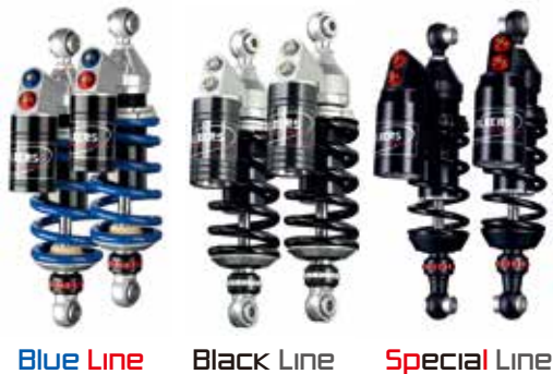
642 TS Competition