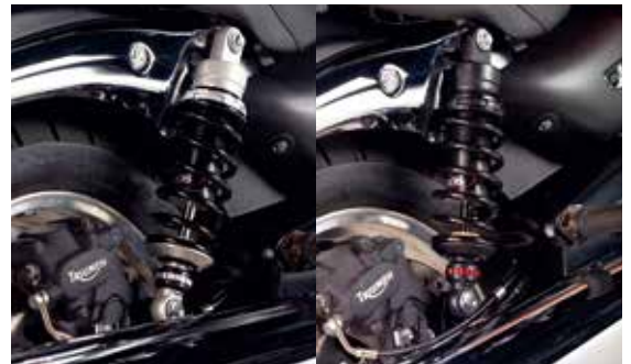
Black Line Special Line