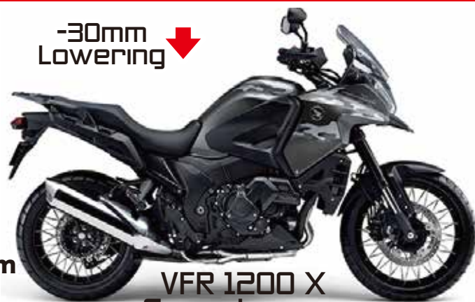
VFR 1200 X Crosstourer