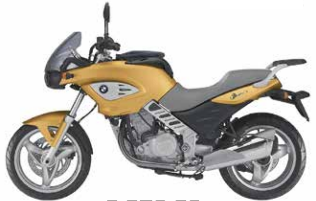
F 650 CS