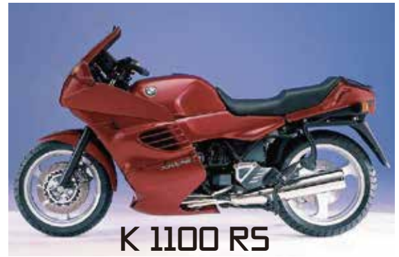
K 1100 RS