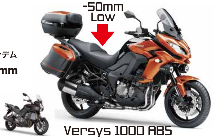
Versys 1000 ABS