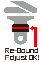
Re-Bound Adjust OK!