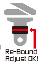
Re-Bound Adjust OK!