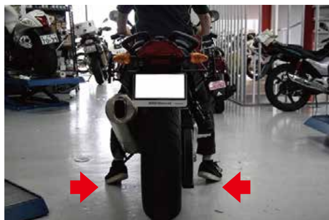
よく見かけるライダーの後ろ姿ですね。見ていて安定感があります。