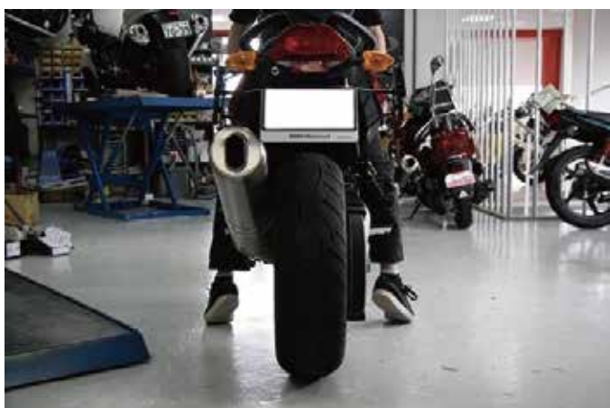
シューズのインソールが見えそうです。これでは厳しいです。