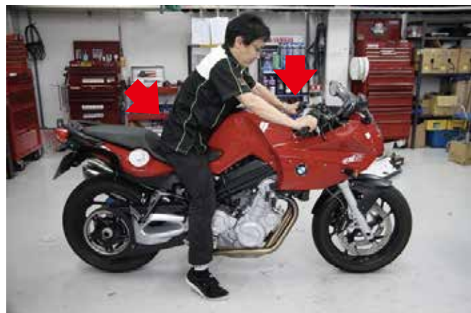
腕の形に注目してください。しっかりと腰がシートに落ちており腕は内側に絞るように力が入ってます。