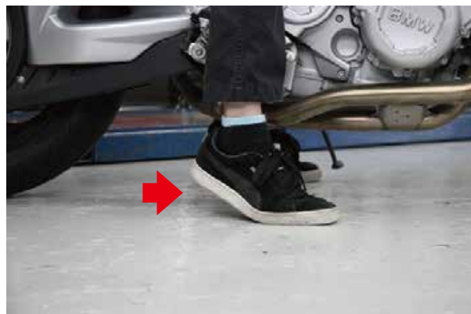
ローダウンで親指の付け根まで着せております。これなら安心して停車姿勢を保てますね。