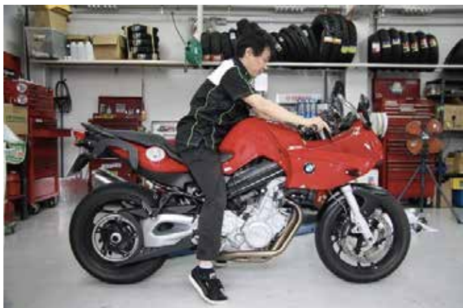
足つきを意識するあまり、腰がシートから浮くような姿勢です。これではいざという時に踏ん張ることができません。