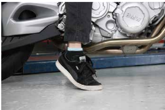
両足ギリギリで若干腰を浮かせてつま先を着地させてます。(この撮影は緊張されたと推測します)