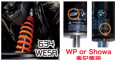
WP or Showa 表記箇所