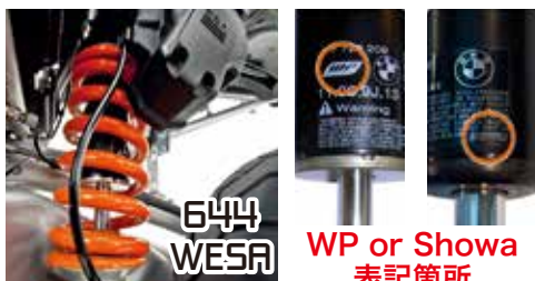
WP or Showa 表記箇所