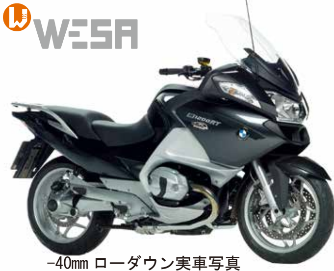
-40mm ローダウン実車写真