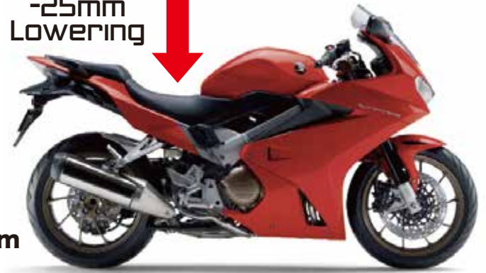
VFR 800 F